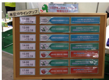
<デモラインナップ>